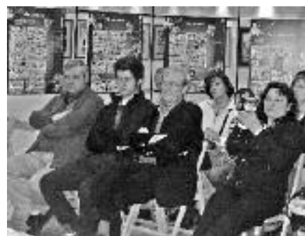
El cònsol general d'Espanya a Andorra, Sr. Francisco Ochoa de Olza, amb ulleres, entre el públic