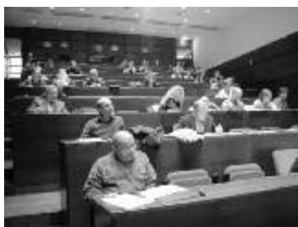
Públic assistent a la sala d'actes de Prada Casadet