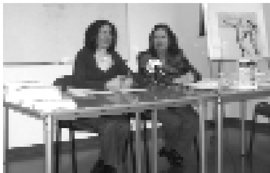
La M. I. Sra. Meritxell Mateu, ministra d'Afers Exteriors, i Àngels Mach, presidenta de la SAC, en la presentació de la publicació.

A dos quarts de 8 de la tarda del dimarts 8 de gener i a la sala de juntes del centre cultural La Llacuna, va tenir lloc la presentació del llibre Models de Pirineu. S'hi pot viure a muntanya al segle XXI? , que recull les 23 ponències que es van fer públiques en les Terceres Trobades Culturals Pirinenques que es van dur a terme a l'edifici de les Homilies, a Organyà, el 21 d'octubre del 2006, en la tercera col·laboració de la Societat Andorrana de Ciències amb el Col·lectiu Pirineus Cultural i l'Institut d'Estudis Ceretans, junt amb l'Ecomuseu de les Valls d'Àneu i PirineuFòrum, l'Àrea de Recerques del Bergadà i el Centre d'Estudis Ribagorçans. En les seves intervencions i l'ampli debat que es va produir durant tota la jornada van quedar reflectides les inquietuds dels ponents, procedents dels diversos territoris pirinencs veïns, que valoren molt positivament la possibilitat de poder reflexionar sobre iniciatives comunes un cop l'any. El llibre conté els textos lliurats pels ponents en 136 pàgines i se n'ha fet un tiratge de 2.500 exemplars, patrocinat pel ministeri d'Afers Exteriors del Govern d'Andorra, l'Institut per al Desenvolupament i la Promoció de l'Alt Pirineu i Aran de la Generalitat de Catalunya (Idapa) i el Patronat Francesc Eiximenis de la Diputació de Girona, que s'han repartit entre les entitats organitzadores.